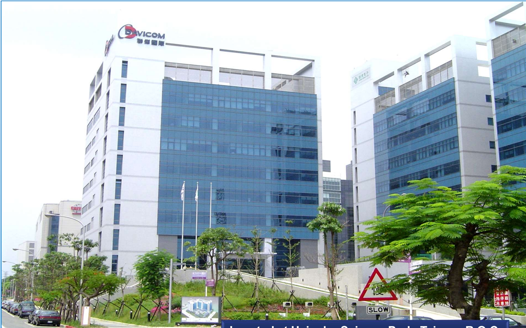
Located at Hsinchu Science Park, Taiwan, R.O.C.